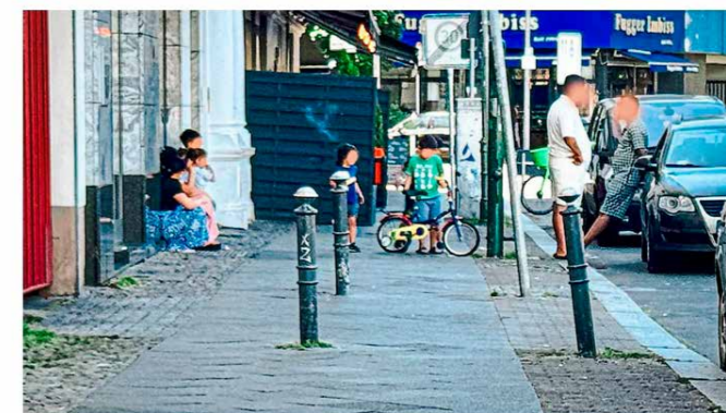
Die Fuggerstraße in Schöneberg wird von Großfamilien aus Bulgarien und Rumänien bevölkert, die vom Bezirksamt im „BB Hotel“ untergebracht werden.